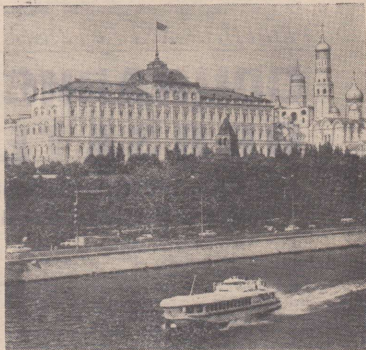
Москва, Большой Кремлевский дворец. 24 ноября 1971 года здесь открылась третья сессия Верховного Совета СССР восьмого созыва.